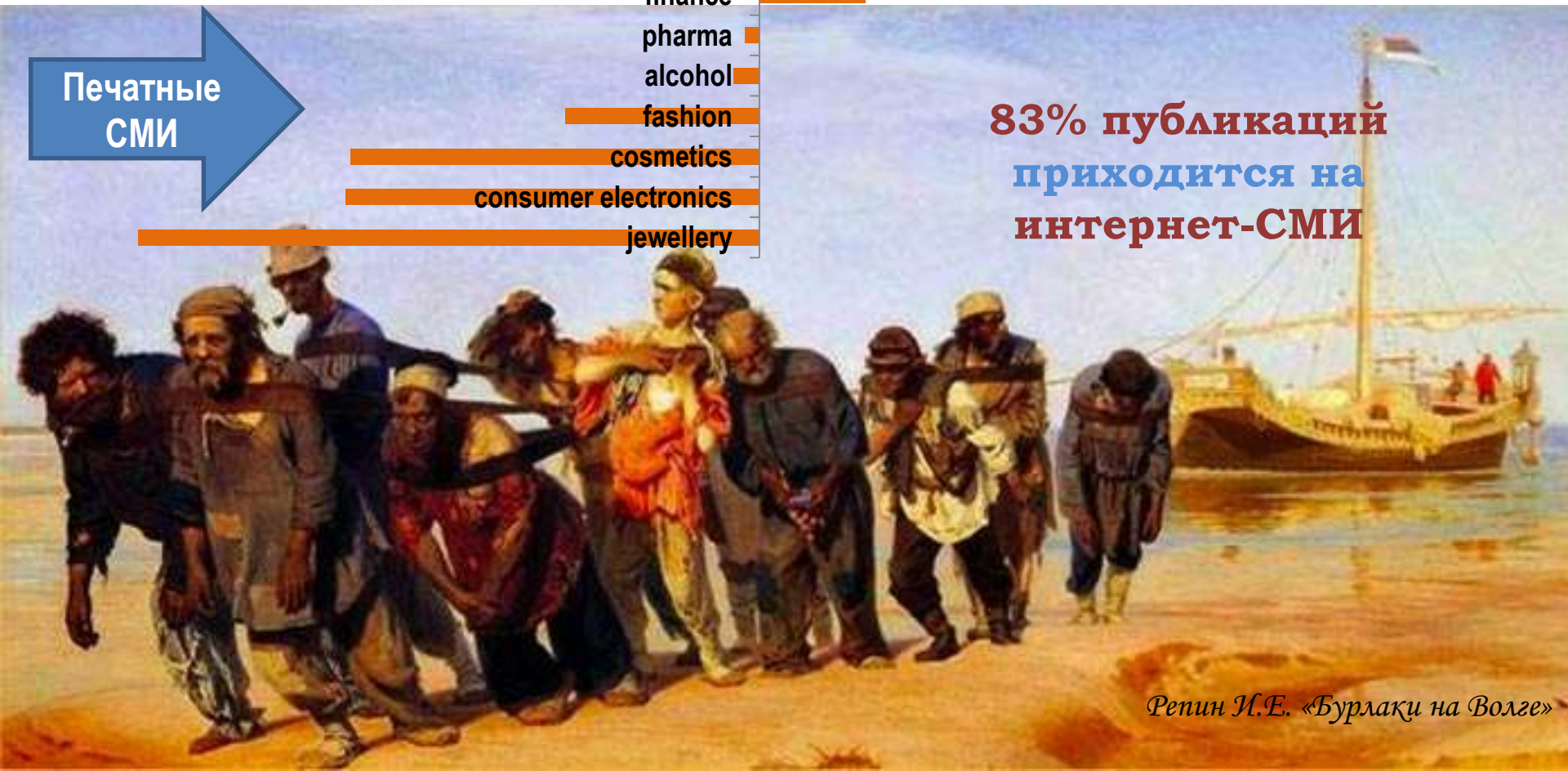
Репин И.Е. «Бурлаки на Волге»

83% публикаций приходится на интернет-СМИ